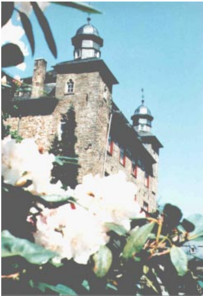
Gerade im Frühsommer, wenn sich die Natur von der besten Seite zeigt, ist es auch auf Schloß Gimborn am schönste: Blumen, Büsche u. Bäume stehen dann in voller Pracht und bilden einen herrlichen Kontrast zu dem alt-ehrwürdigen Gemäuer.

Mehr soll an dieser Stelle über Schloß Gimborn nicht verraten werden, denn die sprichwörtliche "Gimborner Atmosphäre" während der Seminare und die Diskussionsrunden in der heimeligen Turmbar kann man nicht beschreiben, man muß sie ganz einfach erleben!