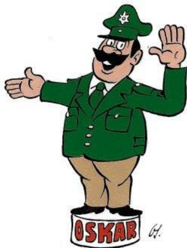
Oskar, der freundliche Polizist

Gegen eine Spende von mindestens 5,- DM erhalten Sie Oskar, den freundlichen Polizisten. Es handelt sich dabei um eine kleine Ansteckfigur, die sich sehr gut als Mitbringsel eignet. Die Gelder kommen dem Sozialfonds der IPA, deutsche Sektion e. V., zugute. Anstecker in Form von Nadeln oder Button erhalten Sie über ihre örtliche Verbindungsstelle.