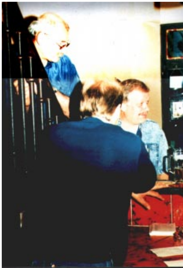
Angeregt diskutiert werden die Seminarthemen zu allen möglichen und unmöglichen Anlässen - aber auch die private Unterhaltung und der dienstliche Erfahrungsaustausch mit Polizisten aus aller Welt kommen nicht zu kurz.