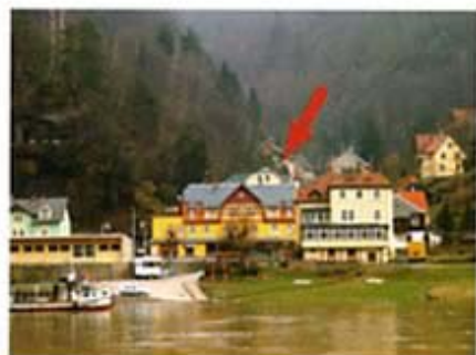
Der Ort Schmilka und das Stiftungs- haus