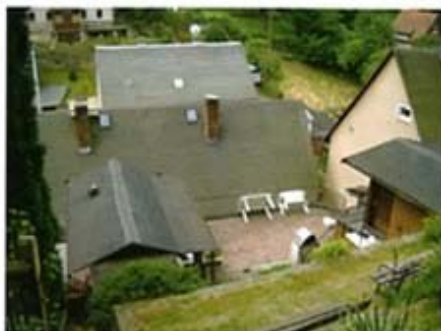
Die Dachterrasse mit Grillplatz

Der gemütliche Frühstücks- und Aufenthaltsraum lädt zum Verweilen und miteinander plauschen ein.